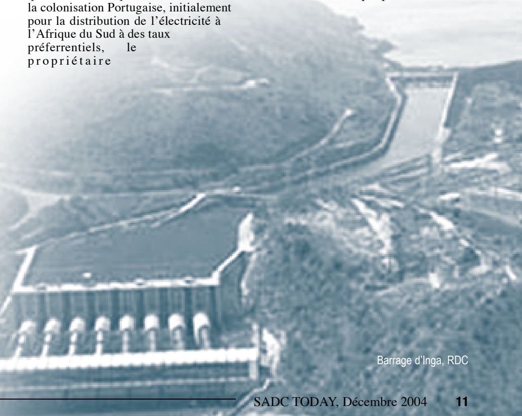
Barrage d'Inga, RDC

Le Portugal évalue la dette à plus de US$ 2 milliard mais le Mozambique estime que c'est impayable. Les deux parties cherchent à trouver un accord pour un chiffre raisonnable de la dette et l'établissement d'un syndicat financier pour réduire la dette à un chiffre aussi bas que possible. □