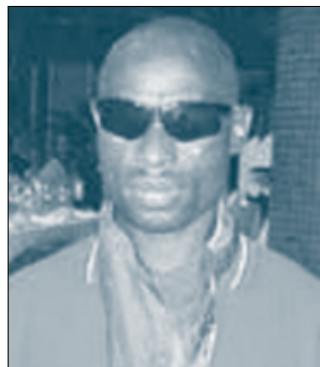
Sports et culture 13