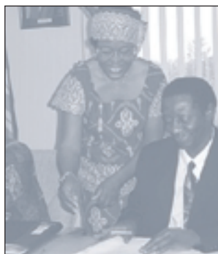
Construção da Comunidade 13