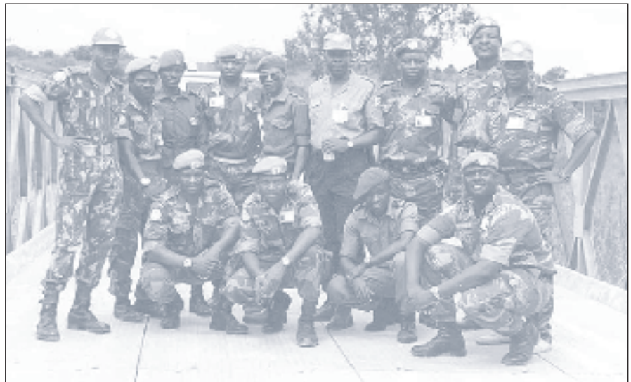
Efectivos africanos na força de pacificação da ONU

implementado com base no Plano Estratégico Indicativo para o Órgão (SIPO), que também foi aprovado pela cimeira de 2003 e define as linhas de orientação para implementação nos próximos cinco anos.