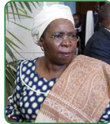
Presidente da Comissão da UA, Nkosazana Dlamini-Zuma

No seu discurso de tomada de posse, ela falou da rica história da África, em que as mulheres desempenham um papel importante nas estruturas económicas e de governação, e, mais recentemente, na luta pela libertação do jugo colonial e do apartheid.