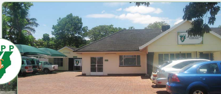
A nova sede do SAPP. Os novos escritórios do Grupo de Empresas de Electricidade da África Austral irão permitir que o organismo de coordenação regional de energia melhore as suas operações e sirva eficazmente as empresas membros. O edifício foi inaugurado durante a 33ª reunião do Comité Executivo, realizada em Outubro, em Harare, Zimbabwe