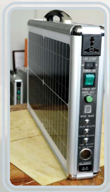
Gerador de energia solar

Fora da rede nacional e regional, a tecnologia solar é usada para o fornecimento de electricidade para as famílias e comunidades. Tecnologias