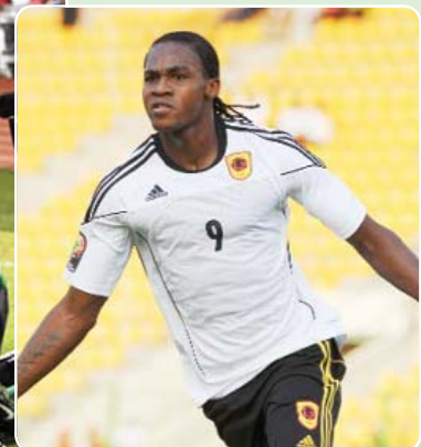
Países da África Austral prontos para representar a região na edição de 2013 da Copa Africana de Nações em Futebol