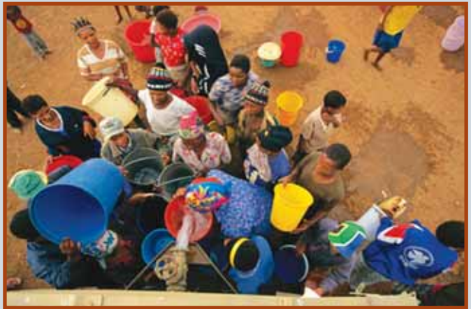
L'investissement en infrastructure d'eau est la clé de développement régional

Facilité de Développement et de Préparation de Projet (PPDF) qui a l'intention de faciliter la préparation de projets bancables.