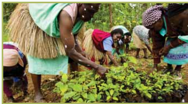
Tree planting is essential to preserving our natural environment

"La réunion vise spécialement à se permettre à la région une opportunité d'avoir une compréhension commune des éditions de l'environnement qui seront discutées au sommet," ont dit les ministres dans une déclaration. □