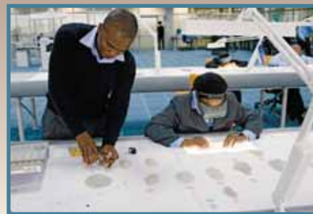
Les travailleurs trient les diamants

Pourtant, puisque le café des années 1990 n'est plus central à l'économie brésilienne. Le pays a diversifié dans d'autres régions en incluant des marchandises ouvrées et les produits "verts" du combustible, en propulsant son économie pour devenir le dixième plus grand dans le monde. □