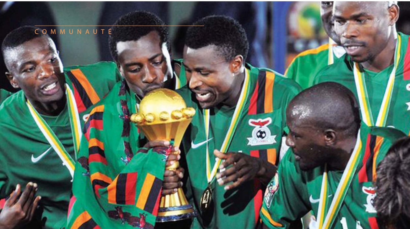
Les joueurs zambiens soulèvent le trophée d'AFCON