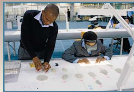
Les travailleurs trient les diamants

Pourtant, puisque le café des années 1990 n'est plus central à l'économie brésilienne. Le pays a diversifié dans d'autres régions en incluant des marchandises ouvrées et les produits "verts" du combustible, en propulsant son économie pour devenir le dixième plus grand dans le monde. □