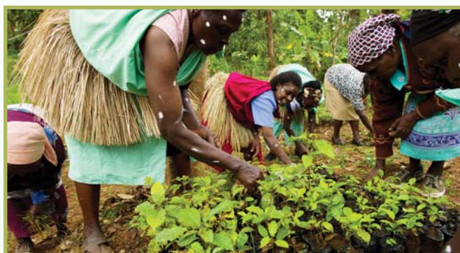
Tree planting is essential to preserving our natural environment

"La réunion vise spécialement à se permettre à la région une opportunité d'avoir une compréhension commune des éditions de l'environnement qui seront discutées au sommet," ont dit les ministres dans une déclaration. □