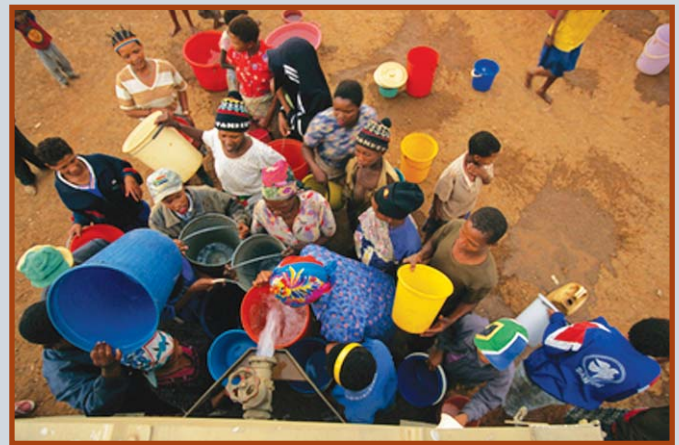
L'investissement en infrastructure d'eau est la clé de développement régional

La SADC a créé un environnement contribuant pour l'investissement, par entre autres, l'implémentation du Protocole sur la Finance et l'Investissement et l'établissement récent d'une