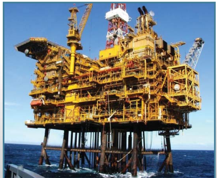
L'Afrique Australe expérimente la popularité du pétrole

The government has started auctioning oil-drilling rights and among the global oil giants scrambling for a share of Madagascar's resources are those from the United States, the United Kingdom, France, the Netherlands, Norway, China and South Korea.