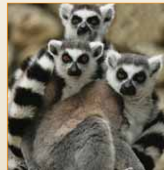
Anel de cauda de lêmures de Madagáscar