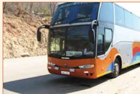
Couloirs de transport en Afrique Australe va faciliter la libre circulation des biens et des personnes.

les plus achalandés des ports de l'Afrique subsaharienne d'entrée avec des centaines de sud ou le nord camions commerciaux en passant par les deux postes frontières chaque jour.