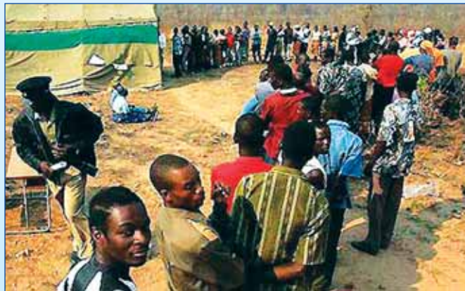
Les Zambiens sont prêts à aller aux sondages, en combinant les élections du gouvernement locale, les élections présidentielles et parlementaires le 20 Septembre 2011.

Isaac a déclaré que le code sera traduit en sept langues vernaculaires principales et les distribuer dans les zones rurales. sardc.net