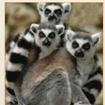
Les makis à la queue d'anneau du Madagascar

Les initiatives de Rajoelina de mettre fin à la crise ont été infructueuses et échoué d'obtenir le soutien national et international. r