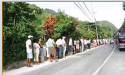
James Michel a été réélu comme Président de Seychelles.

SADC ensemble avec d'autres partenaires a promis d'intensifier ses efforts de garantir la résolution de disputes politiques dans la région. sardc.net r