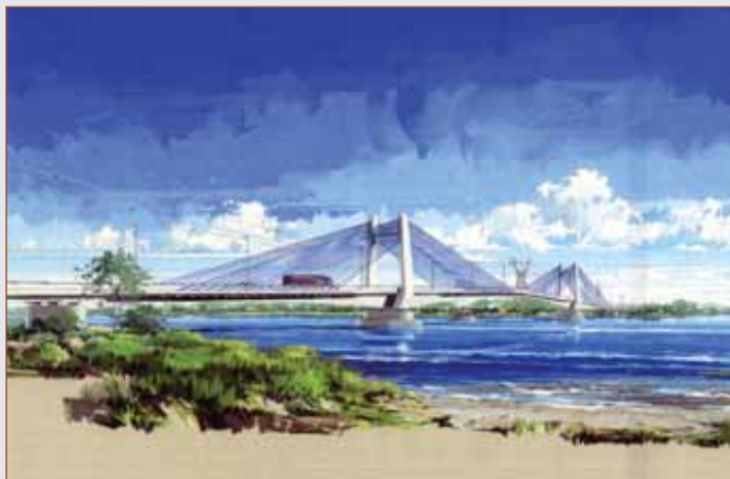
Le pont de Kazungula qui relie le Botswana et la Zambie remplacera le passage actuel et fournira une nouvelle route de transport pour le commerce régional.

Le projet, estimé à plus que US$100 de million, comprend le pont principal qui mesure environ 720 m et 2,980 m pour les routes d'approche.