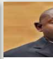
Le Président Zuma, le Roi Mswati et le Président du Burundi Pierre Nkurunziza certains leaders Africains présents à l'inauguration de FTA Africain.