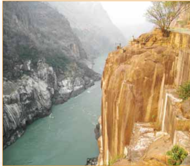
La gorge du Fleuve Zambézi à Cahora Bassa en Mozambique.

Les utilités d'états membre ont identifié un certain nombre de projets de priorité pour commander pendant quelques années prochaines pour adresser la situation d'énergie d'endommagement dans la région.