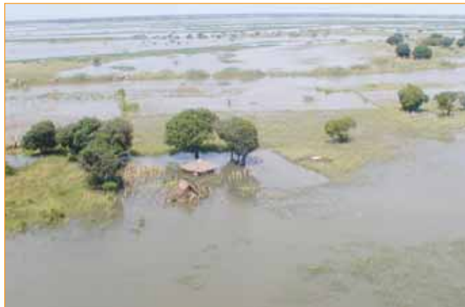
L'augmentation des inondations peuvent être des résultats du dommage environnemental et du changement climatique.

La Convention de Cadre de Nations Unies sur le Changement Climatique (UNFCCC) le Secrétaire Exécutif, Christiana Figueres, a dit que les gouvernements